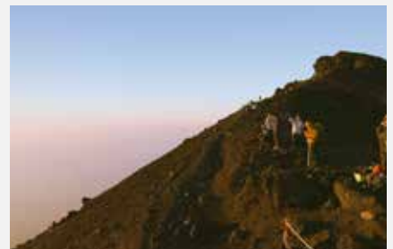
富士登山（山頂付近）