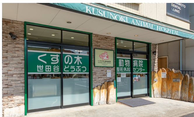
Bệnh viện Thú y Kusunoki

Bệnh viện thú y Kusunoki cung cấp một loại hình chăm sóc y tế mà chủ nuôi thú cưng cũng có thể tham gia. Để tạo ra một môi trường hiếu khách hơn, bệnh viện đã chuẩn bị một không gian đón tiếp có chất lượng không khí dễ chịu để chào đón khách đến viện.