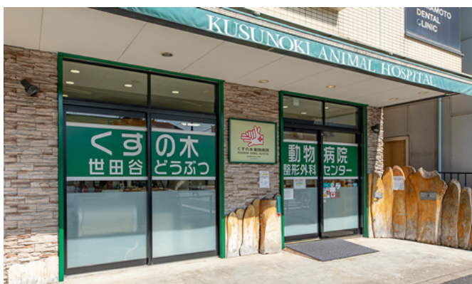
โรงพยาบาลสัตว์ Kusunoki

โรงพยาบาลสัตว์ Kusunoki ให้บริการรักษาพยาบาลในแบบที่เจ้าของสัตว์เลี้ยงสามารถมีส่วนร่วมได้ด้วย เพื่อเป็นสถานที่ที่น่าอยู่มากขึ้น โรงพยาบาลสัตว์จึงจัดสภาพแวดล้อมให้มีอากาศที่น่ายินดีสำหรับผู้มาเยือน